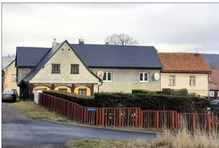
Na dobovém snímku stojí na křižovatce Školní (Lichtenstein Gasse) a Husovy (Schleinitz Gasse) ulice dřevěný podstávkový dům č.p. 146 postavený zhruba v 2. polovině 17. století. Doba jeho demolice není známa. (J. Z.)