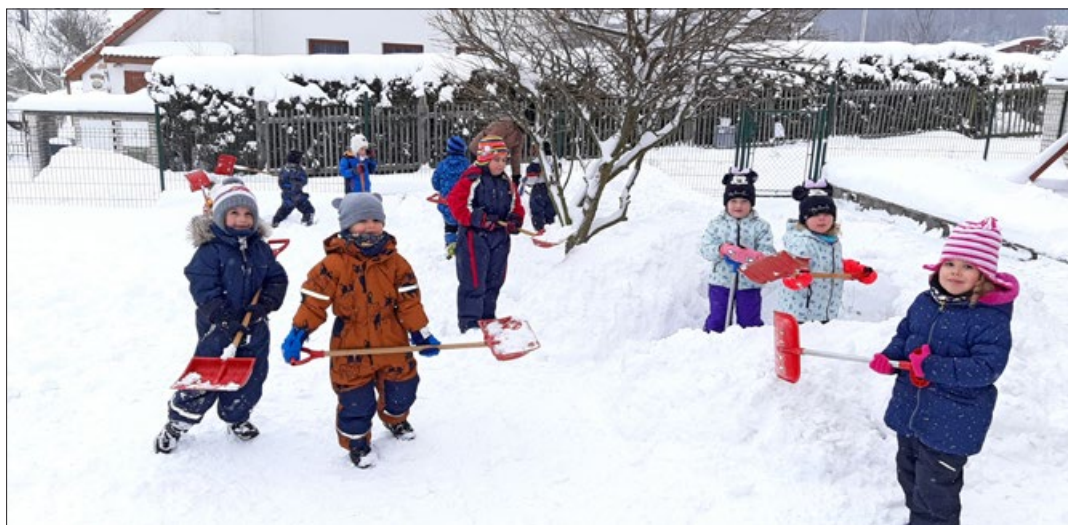
Dětská „pracovní četa“ z Mateřské školy v Dolním Podluží při úklidu zasněžené zahrady

Bohuslav Kaprálik, starosta