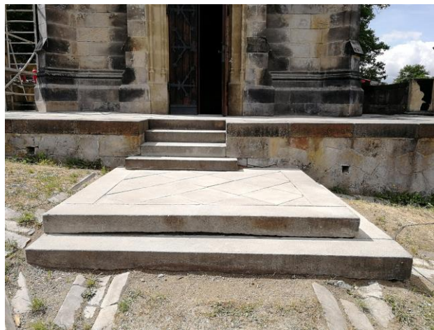
Oprava brassovy hrobky - usazení vstupního schodiště a očištění kamenné terasy