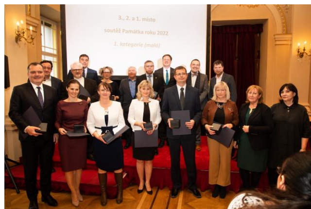
Krajští vítězové soutěže Památka roku 2022