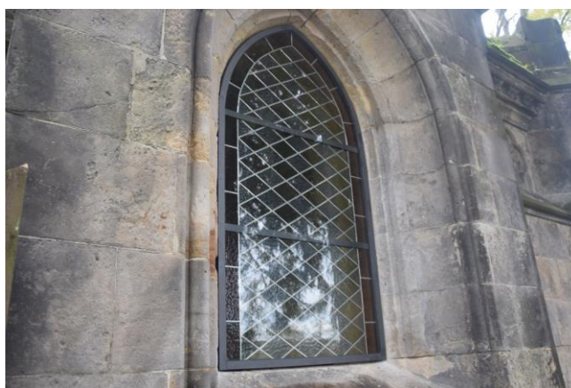
Oprava hrobky rodiny Brass dokončena