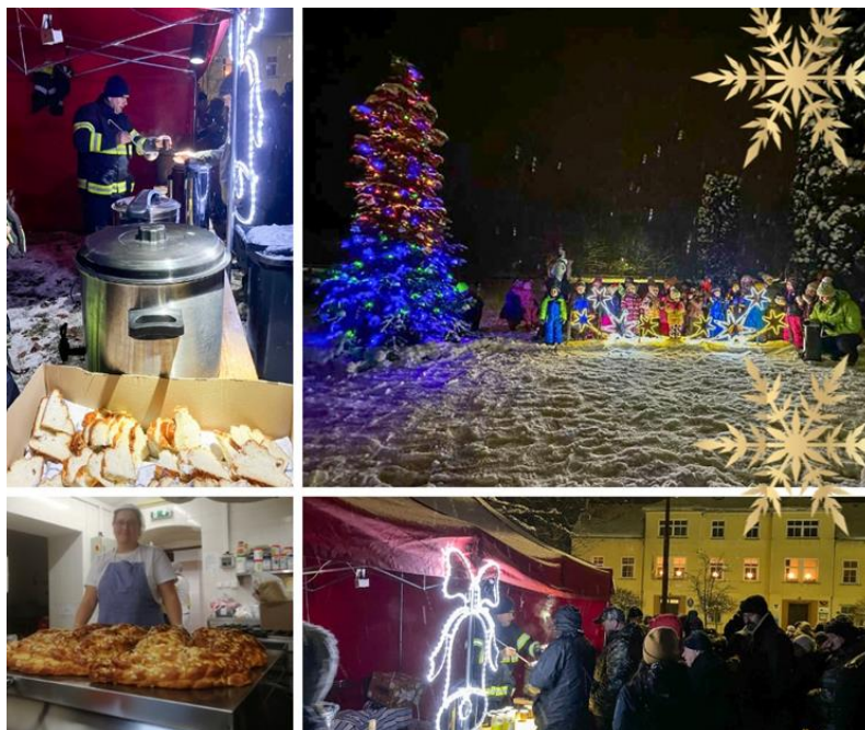
Rozsvícení vánočního stromu