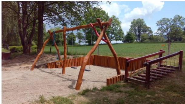
Nové houpačky na koupališti