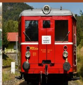
motorový vůz M 131 "Hurvínek"