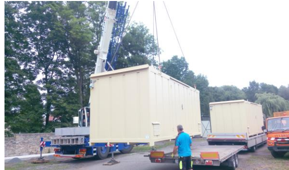
Instalace kontejnerů na elektroodpad