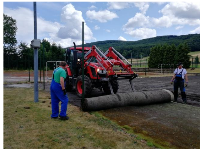
Rekonstrukce hřiště s umělou trávou