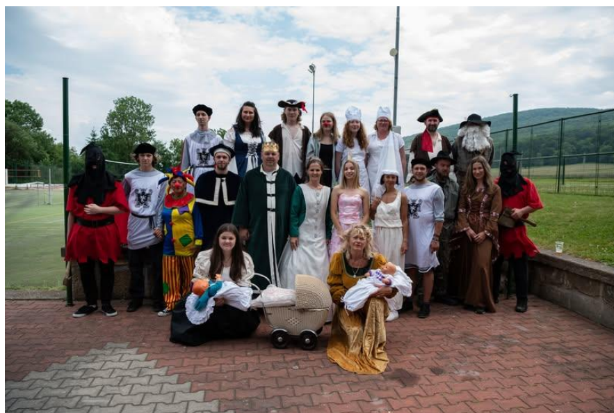
Dětský den „Princové jsou na draka“