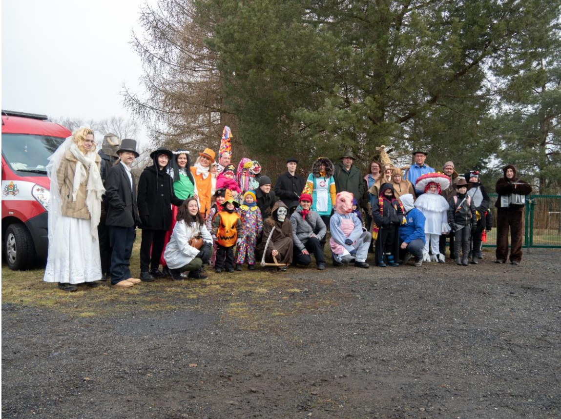
Masopust 2023