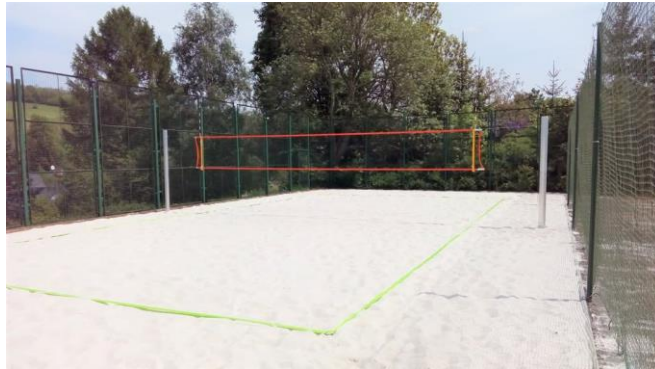
Nové beach volejbalové hřiště