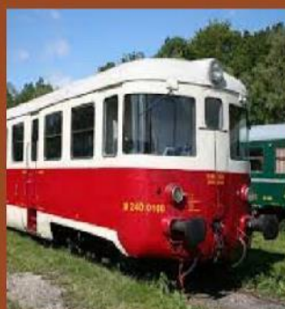
motorový vůz M 240