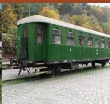
vagón Ae "Rybák"