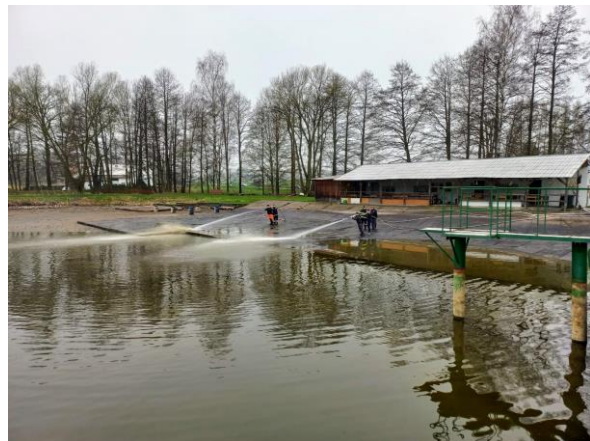
Jarní úklid koupaliště