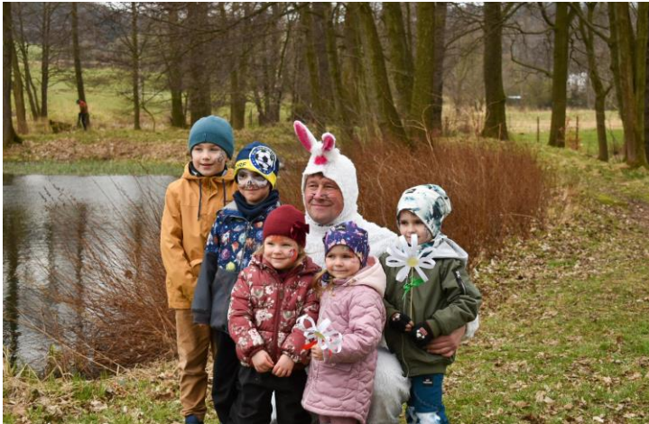
Putování za zajíčkem