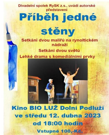
Divadelní představení spolku RySK