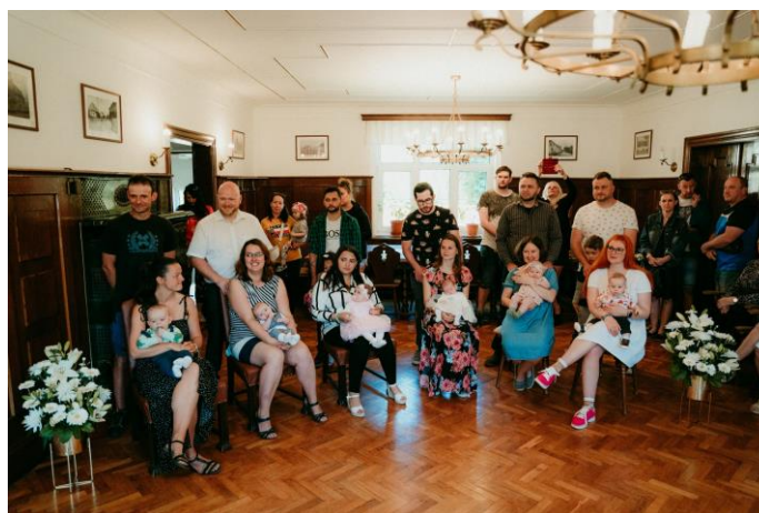
Vítání občánků