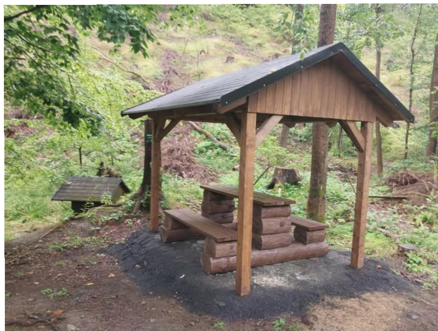
Nový altán na Uhlířské cestě