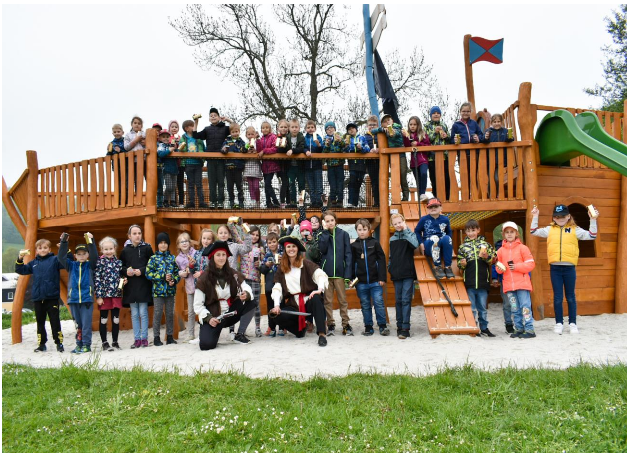
Slavnostní předání pirátské lodi na koupališti