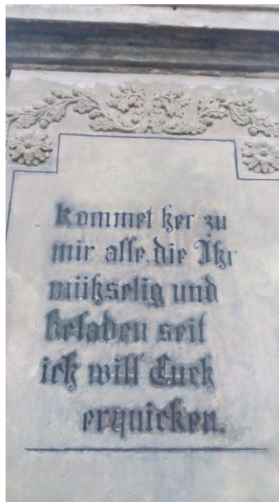
Poslední obnovený křížek v Dolním Podluží