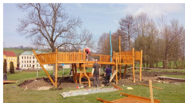
Realizace nových herních prvků na koupališti