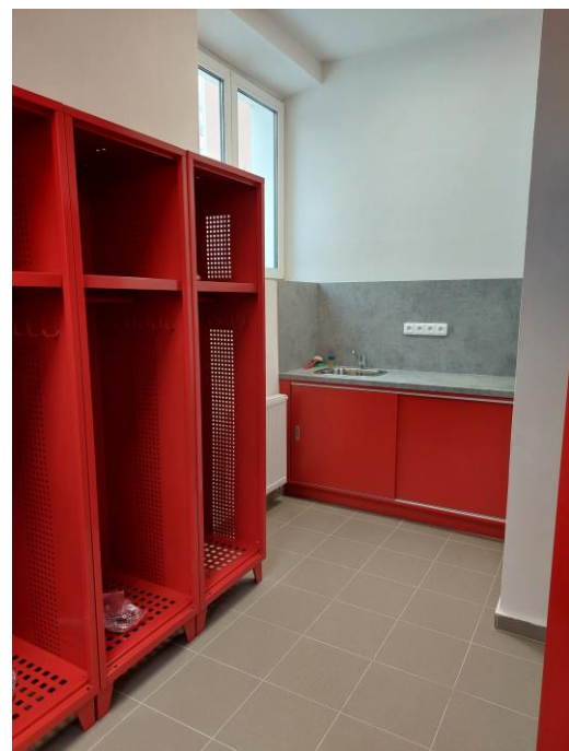
Rekonstruované zázemí hasičské zbrojnice