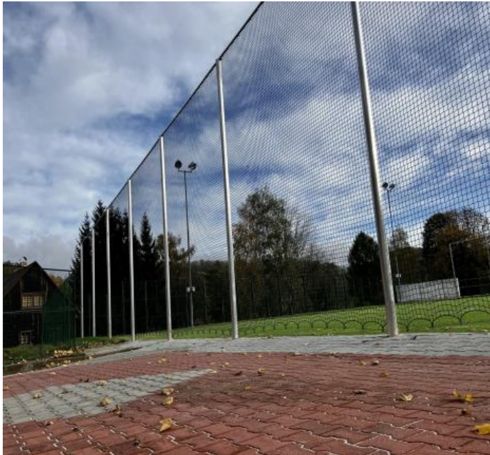
Hřiště s umělým povrchem hotové