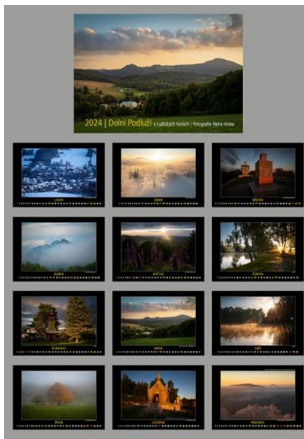
Nástěnný kalendář 2024