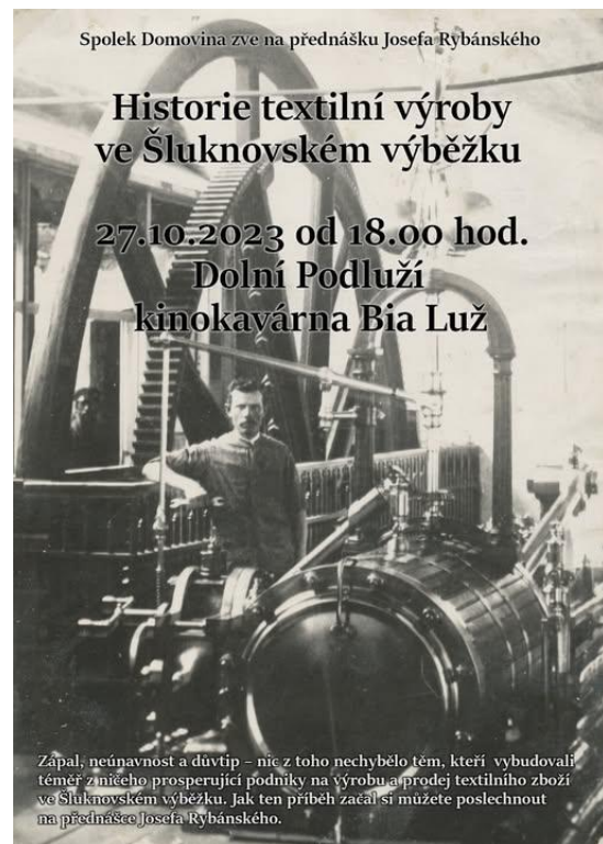
Akce spolku Domovina