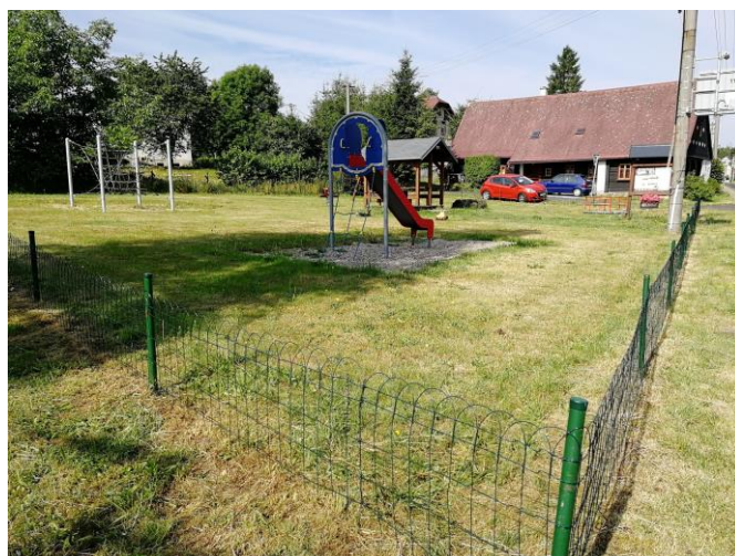
Nový plot u dětského hřiště