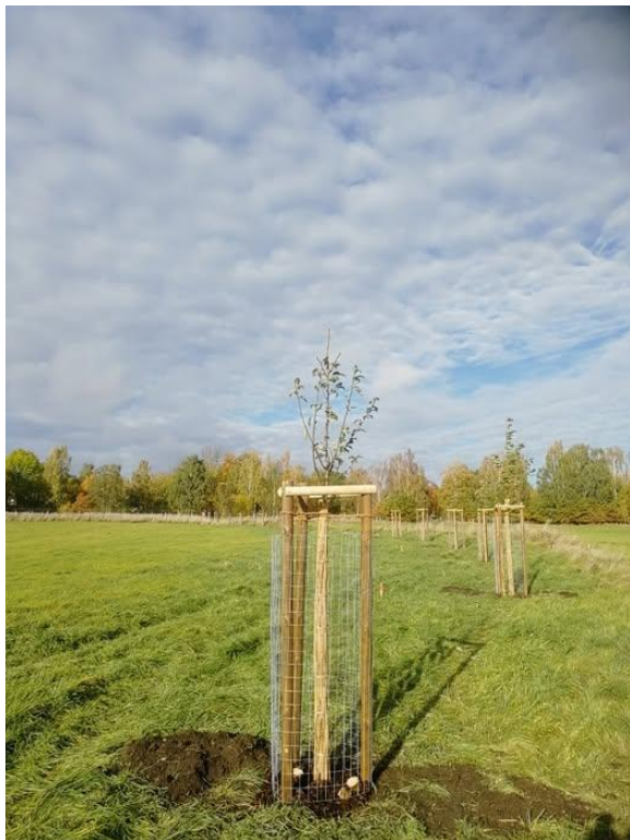
Nová alej ovocných stromů