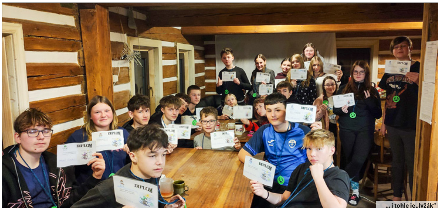
... i tohle je „lyžák“