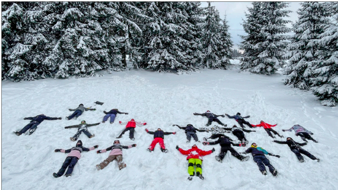
Slet andlíků z naší základní školy v zasněžených Jizerských horách. Kromě samotného lyžařského výcviku nebyla nouze ani o zábavu. Více na straně 5