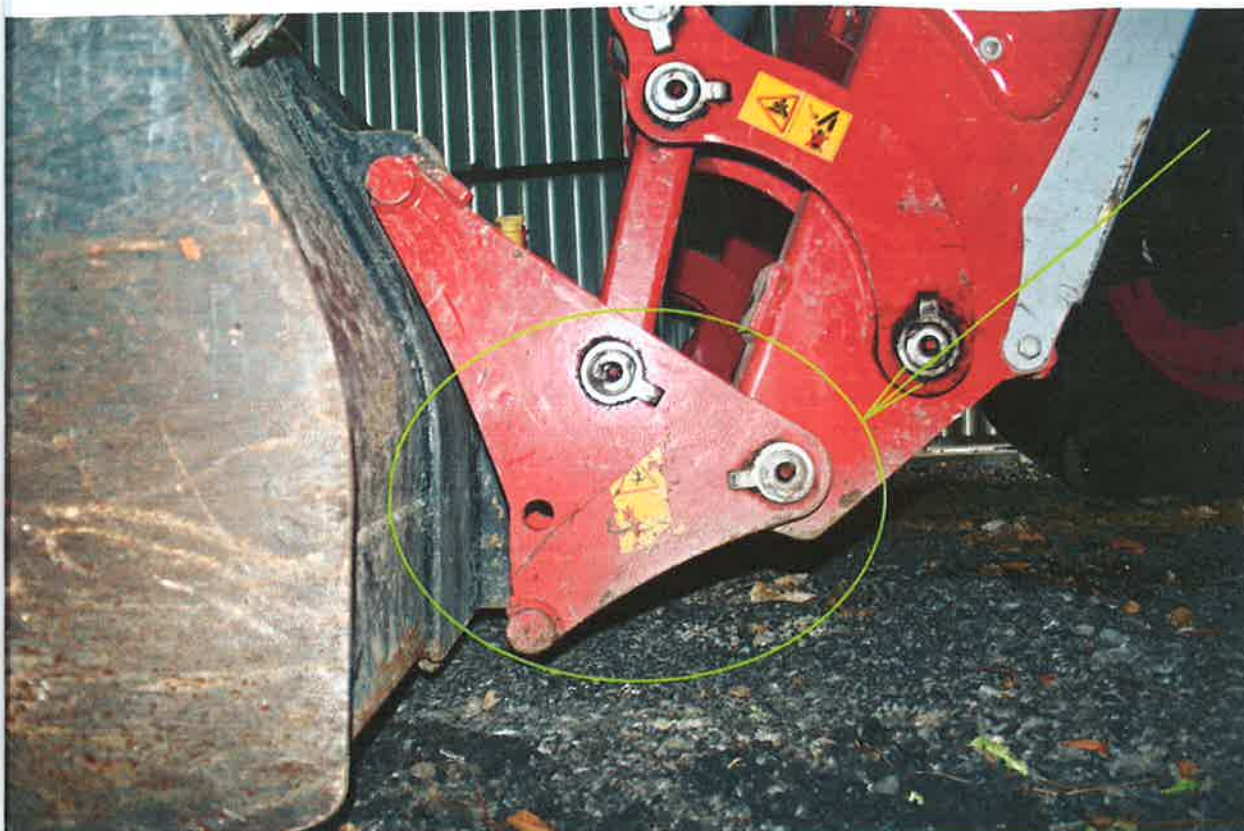
3. Pohled na čepy a otvory pro čepy nosíku nakládací lžice, které jsou vyosené.jpg 09.07.2020 13:19