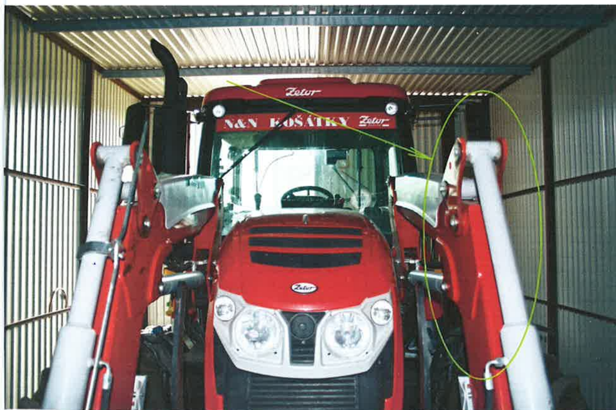
2. Čelní pohled na pravý výložník.jpg 09.07.2020 13:19