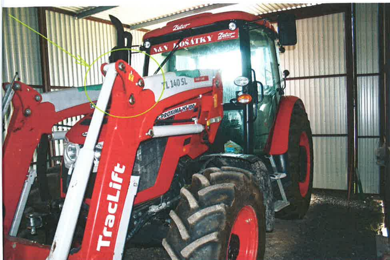
1. Celkový pohled na traktor s označením pravého výložníku, který je vyšší než levý .jpg 09.07.2020 13:21