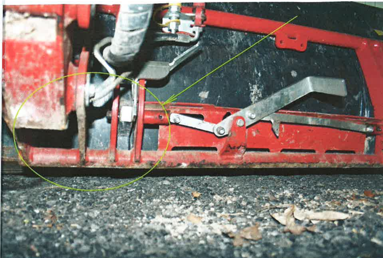
5. Pohled na spodni trubku nosniku s čepy pro ovládací prvky, kdy trubka je vyhnutá, čepy vyosené..jpg 09.07.2020 13:19