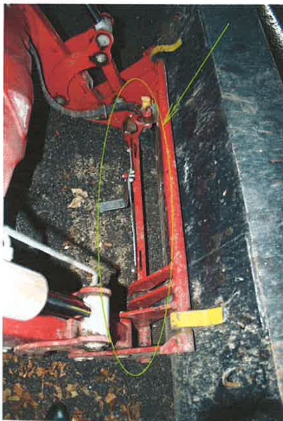
4. Pohled na trubky nosíku nakládací lžice, které jsou vyhnuté.jpg 09.07.2020 13:20