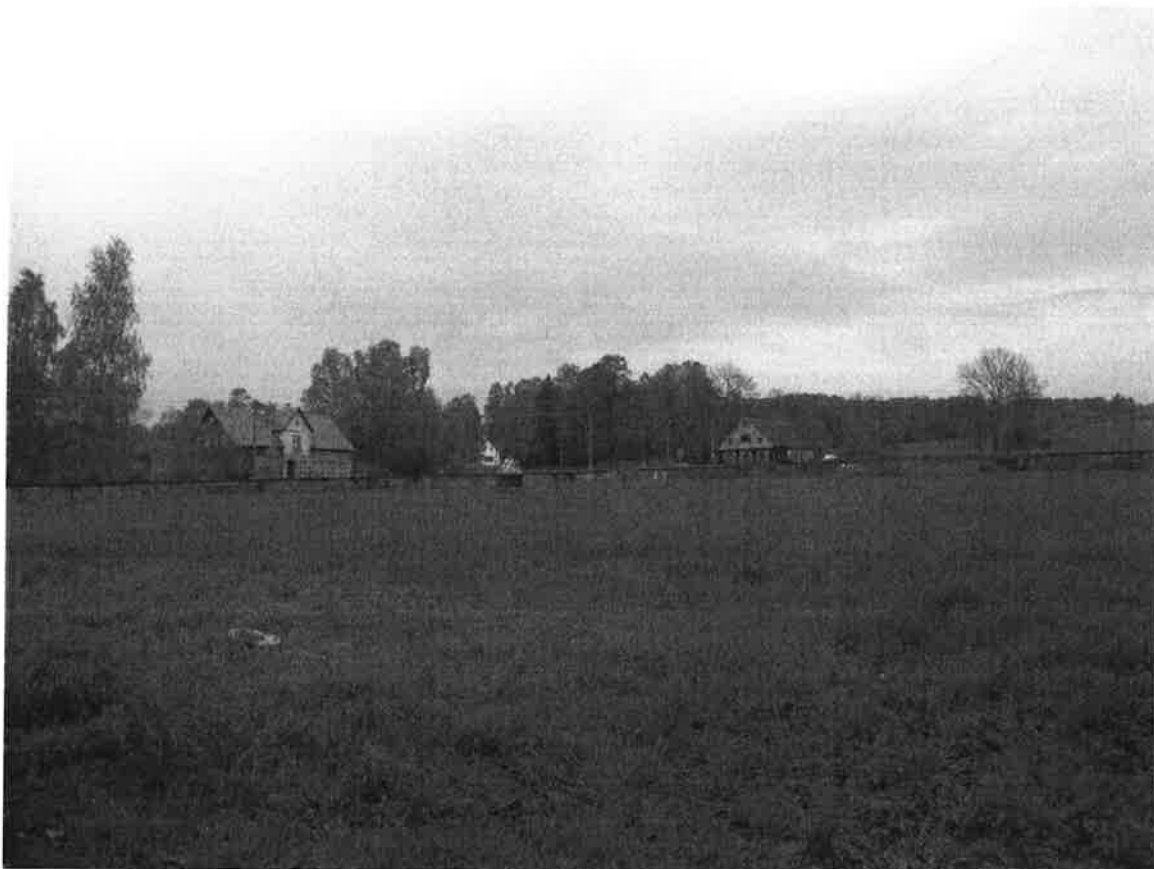
Pohled na prostor zahrady